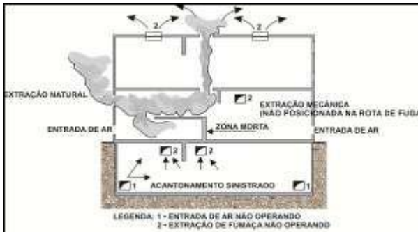
Figura 2 – Zonas mortas