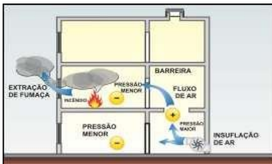
Figura 3 – Diferencial de Pressão

4.1.3 O controle de fumaça é obtido pela introdução de ar limpo e pela extração de fumaça, pelos seguintes tipos de sistemas, conforme Tabela 1.