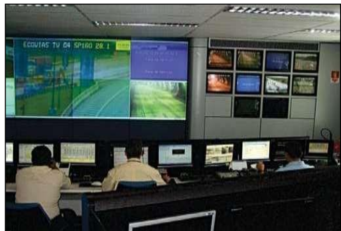
Figura 3 – Central de monitoramento

5.10.4 A central de monitoramento (controladora) do sistema de circuito interno de TV deve ter vigilância habilitada durante todo o período de funcionamento diário do túnel.