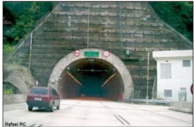
Figura 2 – Sinalização na entrada do túnel

5.9.2 Para os túneis acima de 1.000 m, devem ser instalados painéis internos eletrônicos a cada 500 m, indicando as condições de segurança no túnel.